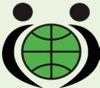
Onterp logo Aktief

Wie we vooral ook niet mogen vergeten zijn de zusters in Brazilië die vanuit daar alles regelden en vele uren maakten met de kinderen, maar ook nog eens de spullen verdeelden die werden verstuurd en mensen zochten die konden helpen met het opbouwen van bepaalde projecten.