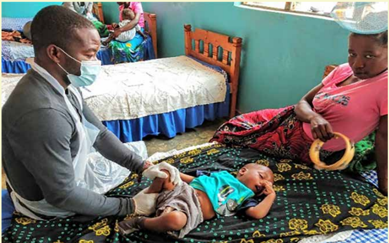
De wekelijkse sessie in het Dawn Center