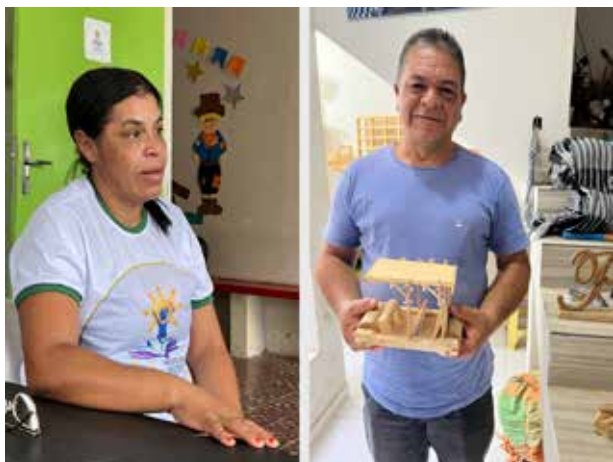
De Braziliaanse staf