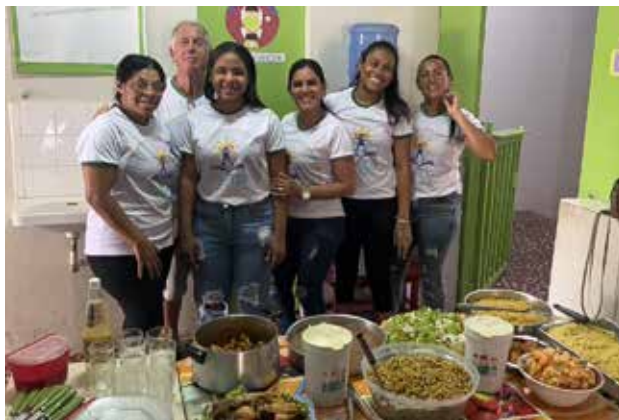
we werden goed verzorgd