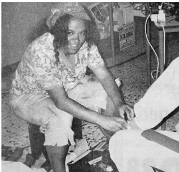
Schoenenpoetsen februari 1993

bleek te zijn, heeft ze besloten om niet naar haar biologische ouders te gaan zoeken. Ze heeft, als kind, wel altijd gezegd dat als ze oud genoeg was, ze graag naar Brazilië terug wilde om de zusters te helpen die het mogelijk hadden gemaakt dat ze geadopteerd is. En dat heeft ze dan ook gedaan in de periode 1999- 2000. Ze is toen als vrijwilliger gaan werken in het kindertehuis Lar da Criança in Palmeira dos Indios, de plaats waar ze geboren is. Helaas waren alle zusters uit de beginperiode al overleden, maar de Braziliaanse zusters hebben het stokje overgenomen. Toen ze daar was zag ze met eigen ogen waarom Aktie voor Aktie zo belangrijk was en nog steeds is voor de mensen al daar. Nog steeds gaan de zusters de huisjes op de berg (de Cruzeiro) langs, om te kijken of mensen wel geregistreerd zijn en hoe hun leefomstandigheden zijn. De kinderen die naar het kindertehuis komen, krijgen drie keer per dag eten, ze krijgen les op school en op de crèche en hebben daardoor een beter toekomstperspectief. Ze snapt nu ook heel goed wat de drijfveer was van haar vader en haar moeder. En waarom ze zich altijd met volle overgave hebben ingezet voor Aktie voor Aktie en de mensen in Brazilië. Zo weet ze bijvoorbeeld nog goed dat hun hele zolder vol stond met bananendozen en mensen aan de deur kwamen om kleding en andere spullen te brengen. Zij, haar broertje en zus mochten vaak de stickers op de bananendozen plakken voordat ze werden opgehaald en per boot naar Brazilië gingen.