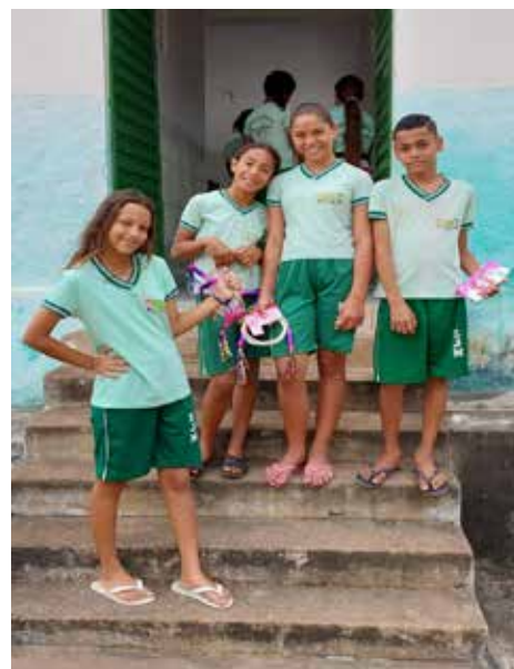
De kinderen van de cover 2019 staan, poseren in 2022 weer voor de foto