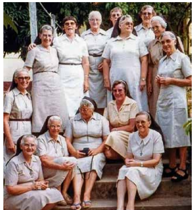
De zusters van het eerste uur

Van de zusters had hij ook acht foto's van kinderen en hun beschrijving/ levensverhaal meegekregen, met de vraag of iemand ze financieel wilde adopteren zodat zij naar school konden gaan, het gezin ondersteund werd en op die manier een kansarm kind een toekomst werd geboden.