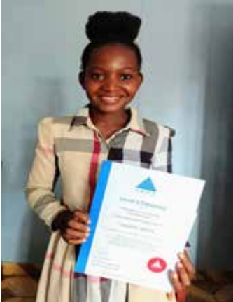
Callister Sekeya Community Development.